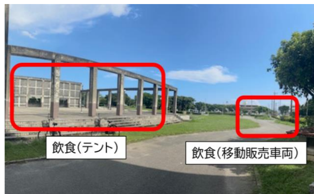
「飲食」出展エリア（総合体育館外）